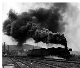
▲昭和46年まで若松にも炭鉱がありました。その頃の二島駅です。

今回の企画展では、これまで『北九州市 時と風の博物館』に投稿された情報を約50の作品と4つのシリーズのパネルで紹介しています。「橋」「祭り」「坂道」「SL」等のシリーズをはじめ、今まで知らなかった、気付かなかった新しい北九州市の魅力が見つかるかもしれません。