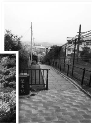
▲ 洞海湾を望む、くるがね線と宮田山トンネル上の坂道です。