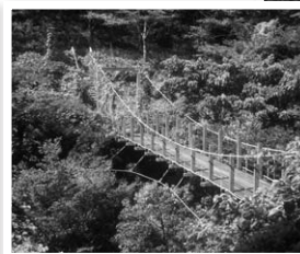
▲この吊り橋がどこにあるかご存知ですか？ 河内貯水池付近の桜吊り橋です。